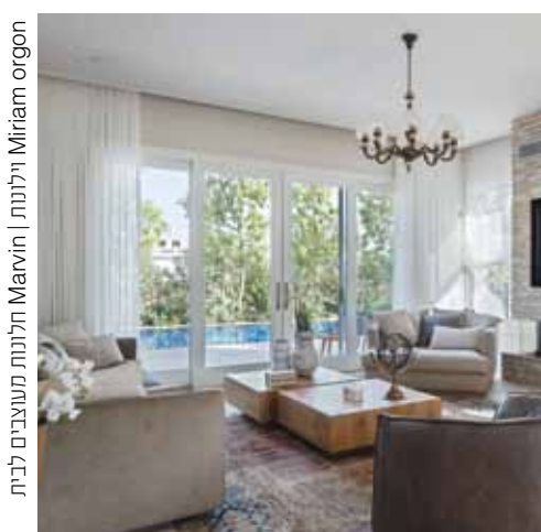
Miriam organ חלונות וילונות | Marvin חלונות מעוצבים לבית

פרויקט ואנשי אדמיניסטרציה. זהו המקום בו נרקמות התוכניות, בו מסכרנים לוחות הזמנים עם תוכניות העבודה ובו נסגרים כל הקצוות באופן הרמטי, לפני תחילת העבודה בשטח. לדבריה, בסטודיו לאדריכלות ועיצוב פנים איכותי מתרחש קסם - במידה ויודעים להעניק את תשומת הלב הגדולה ביותר לפרטים הכי קטנים. "בסופו של דבר", היא מסכמת, "בית, רחב ומעוצב ככל שיהיה, הוא חלל שחייב ליצר אינטימיות ותחושת ביתיות לצד נוחות ונגישות, ברמות הגבוהות ביותר. היכולת לשלב בין כל הפרמטרים הללו בעבודת תכנון ועיצוב בתי יוקרה, היא הערך המוסף שאני מעניקה למי שיתגורר בבית בסוף התהליך".