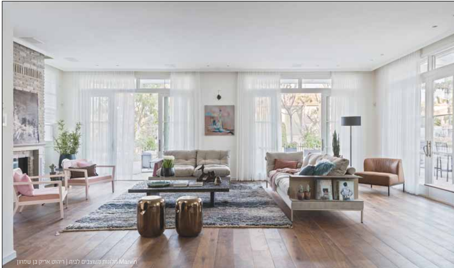
Marvin חלונות מעוצבים לבית | ריהוט אריק בן שמחון