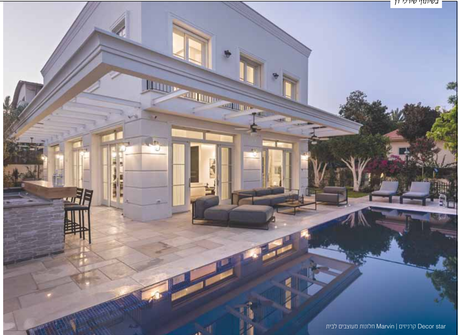
Decor star קרניזים | Marvin חלונות מעוצבים לבית