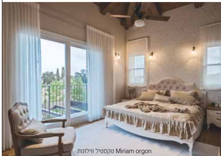
Miriam organ טקסטיל וילונות