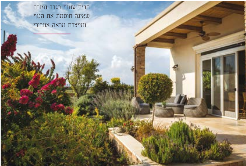
הבית עטוף בגדר נמוכה שאינה חוסמת את הנוף ומייצרת מראה אוורירי