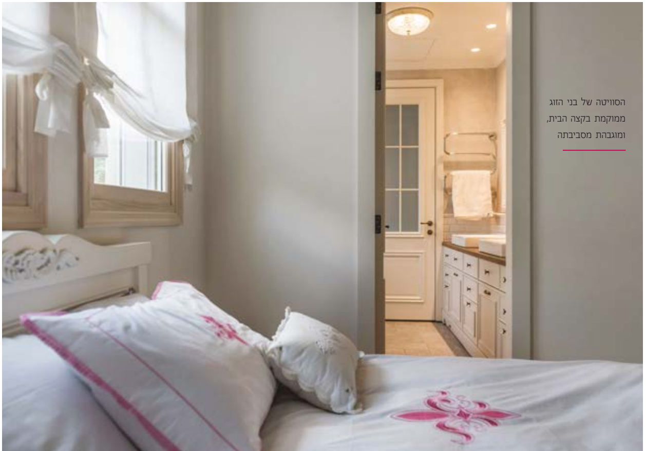
הסוויטה של בני הזוג ממוקמת בקצה הבית, ומוגבהת מסביבתה