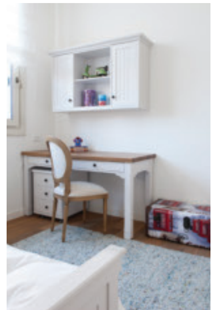
מעטפת בהירה והרמונית בחדרי השינה