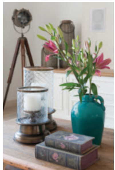
אווירה טוסקנית מאפיינת את חללי הבית

לבין אגף החדרים. בציוד הפונה לכיוון הסלון הוטמע קמין בסגנון אירופאי ומעברו השני ארון גדול בעל שבמרכזו מדפים פתוחים עליהם מוצבים אלמנטים דקורטיביים, כמו גם תמונות משפחתיות