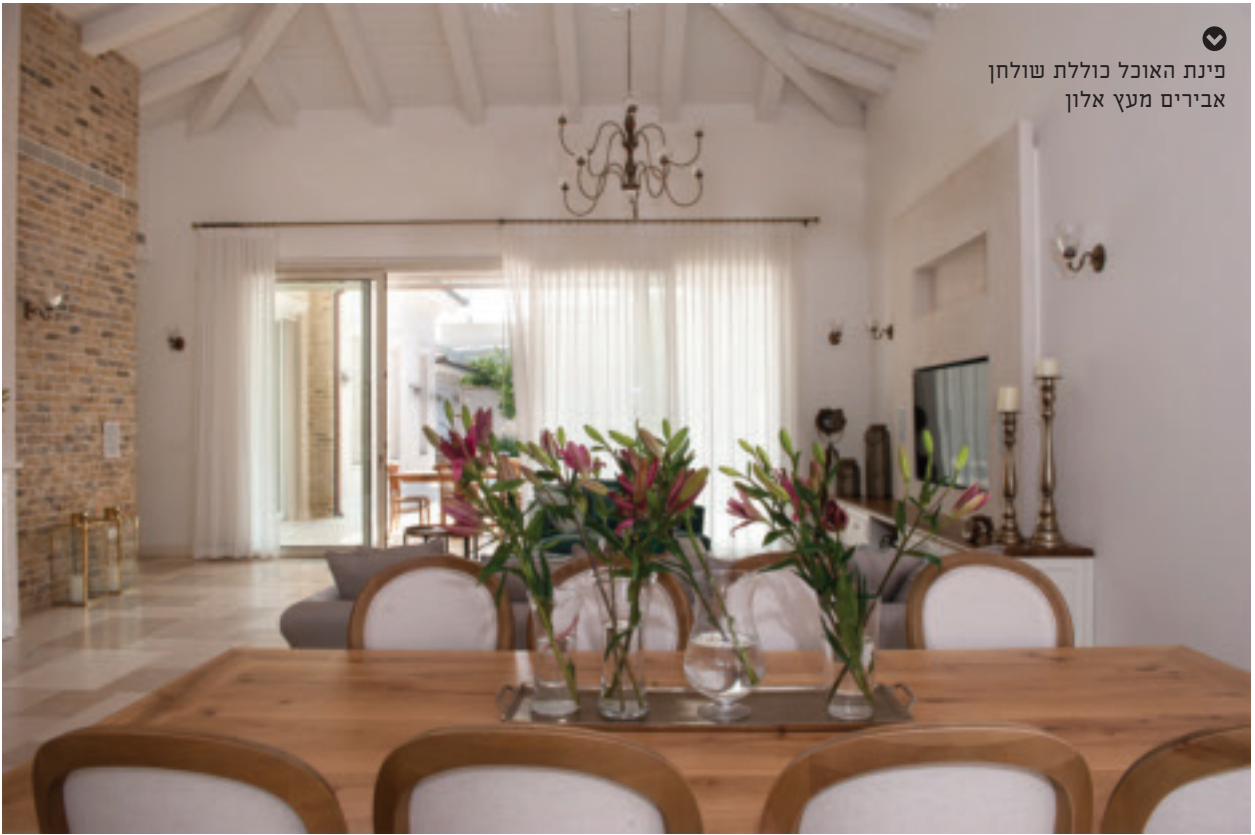
פינת האוכל כוללת שולחן אבירים מעץ אלון

המיתמרת לגובה של למעלה משישה מטרים. העץ הגושני המוברש ממנו היא עשויה נצבע בלבן ובכך מתגברת תחושת הגובה והמרחב בחלל. רצפת החלל הותקנה בקומפוזיציה א-סימטרית מאבן בורגון טבעית מפירוק בצבעוניות חמימה וטבעית. האגף הציבורי כולל את המטבח, פינת האוכל והסלון ותוכנן בקונספט פתוח גדול, אוורירי ומואר. שתי יציאות רחבות ידיים, האחת מהמטבח שמתחברת לפינת הישיבה שבחצר הקדמית והשנייה מהסלון המובילה לחצר האחורית הכוללת את בריכת השחייה, פינת אירוח